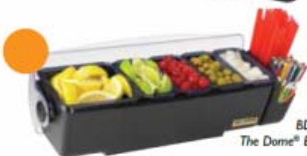
BD4005E The Dome® Essential

Джусмастер - официальный дистрибутор San Jamar в России Web: www.sanjamar.ru www.juicemaster.ru Москва, Варшавское шоссе 42, офис 6286 (495) 225-22-30