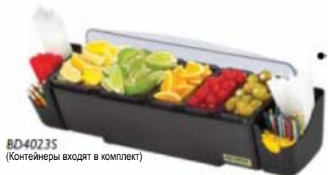
BD4023S (Контейнеры входят в комплект)