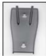
(1) Монтажный кронштейн