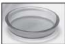
(1) Дренажный колпачок