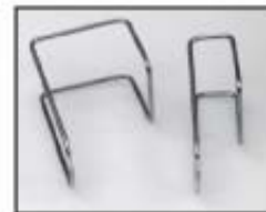
(2) Проволочных кронштейна